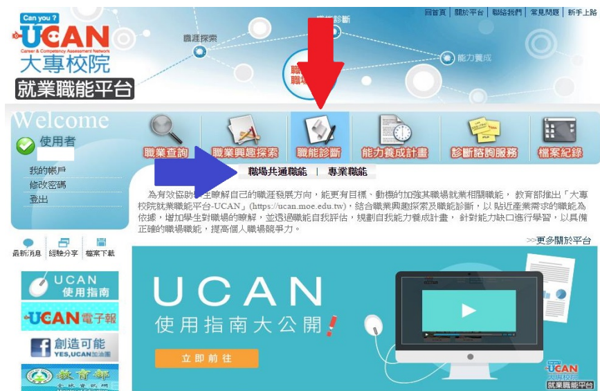
圖 2：請依箭頭指示點選「職能診斷：職場共通職能」