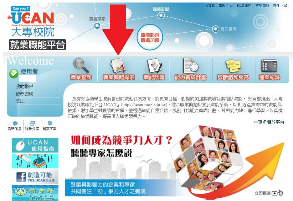
圖 1：請依箭頭指示點選「職業興趣探索」

*(十)大專校院就業職能平台 UCAN， https://ucan.moe.edu.tw 。請自行連結登入該平台，帳號請鍵入 0024 加學號 ，密碼請鍵入 0024 加學號 ，再鍵入驗證碼後即可使用，施測項目為 1.職業興趣探索 ， 2.職能診斷：職場共通職能 。【詳見附錄說明】